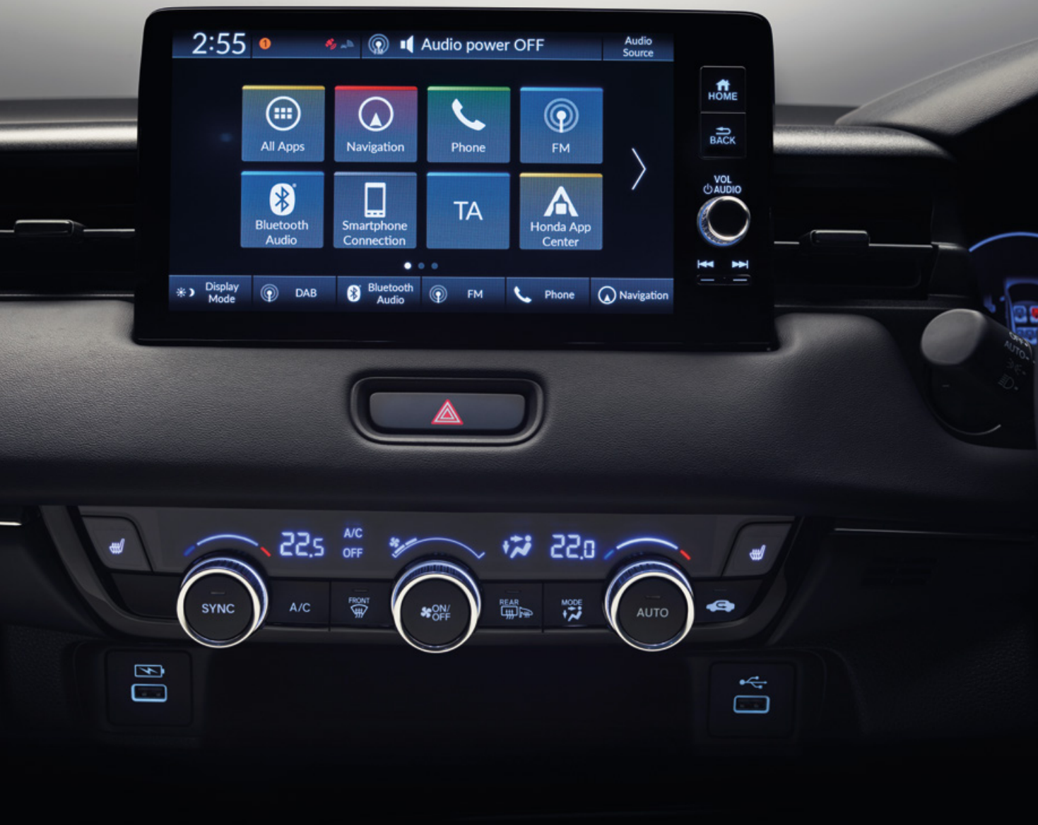
Vadonatūj Honda HR-V